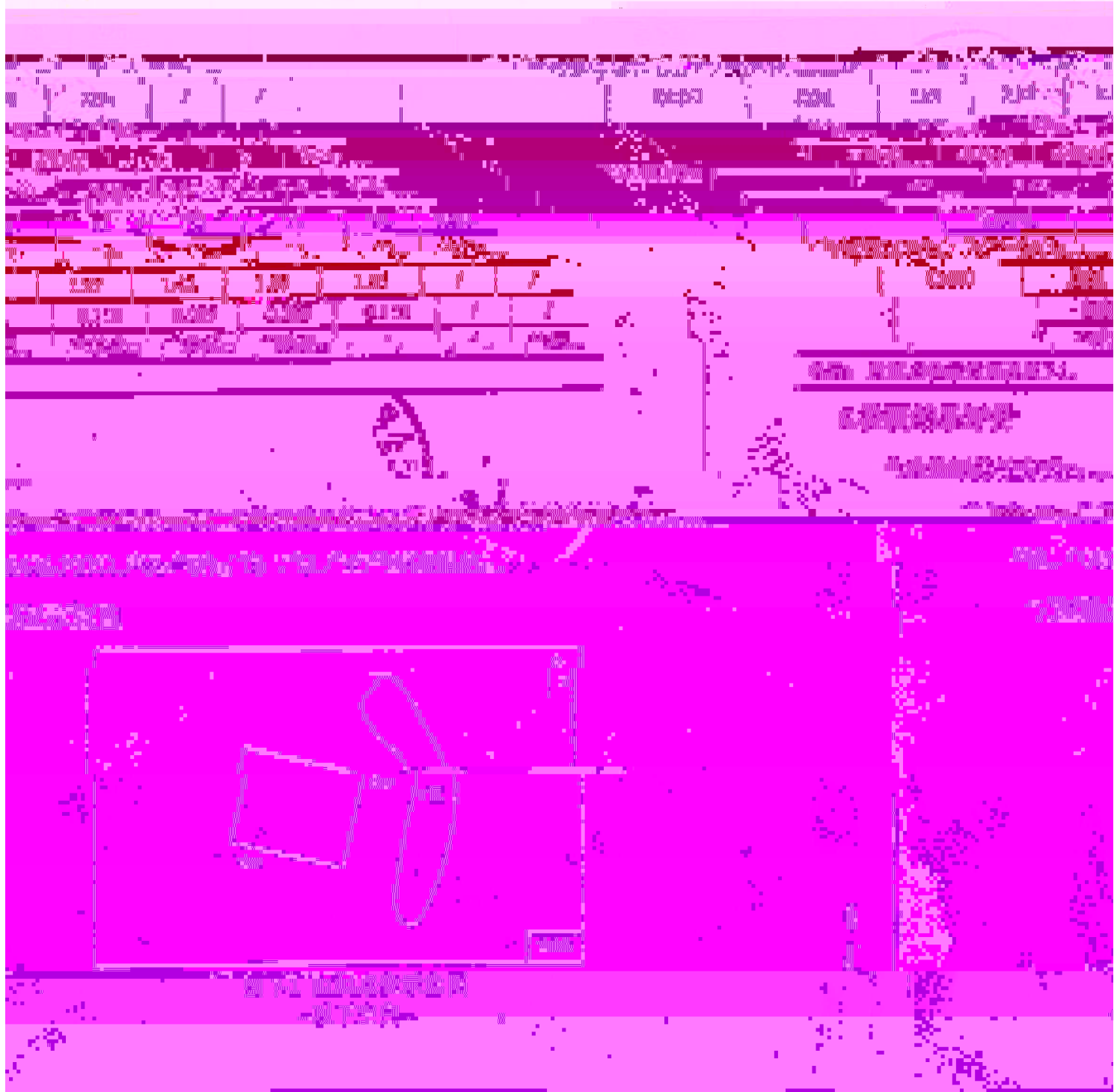
图 5.1 图例